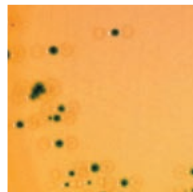
Salmonella H 2 S(+) Salmonella H 2 S(-)