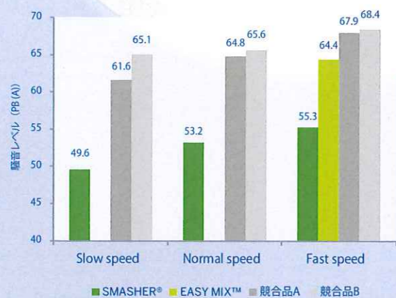
図：各スピードレベルでの騒音レベル比較