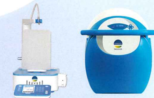
秤量機能付き希釈装置 DILUMAT® シリーズ